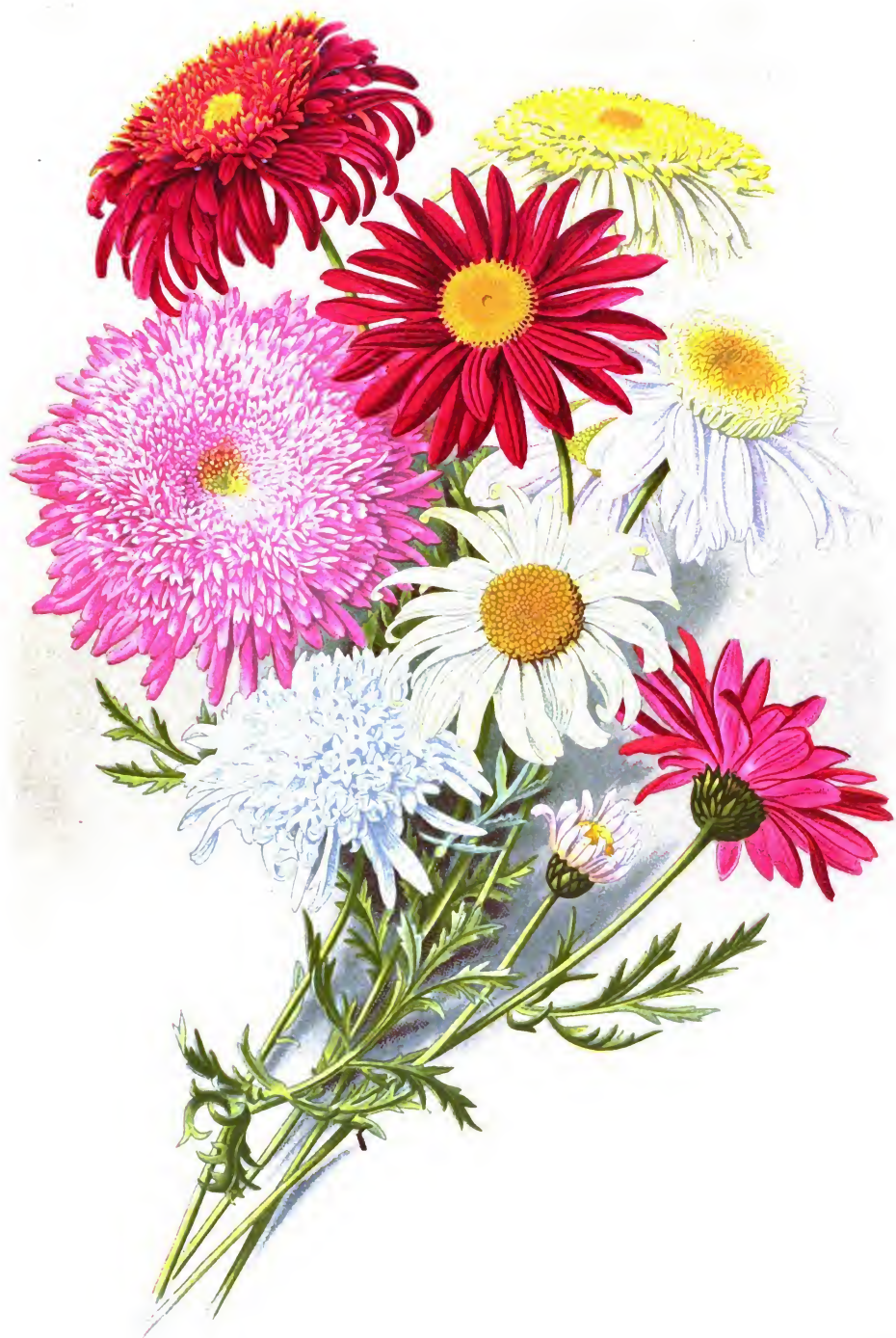
Pyrethrum roseum hybridum M. B.

Ромашка персидская въ махровыхъ и не махровыхъ сортахъ.